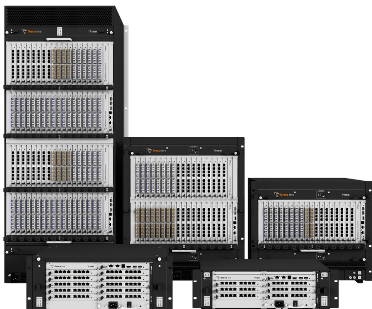
Abbildung zeigt Geräte mit E/A-Karten (müssen separat bestellt werden)